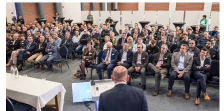
Terugblik Aannemers- avond en Veiligheidsdag