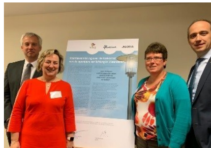
Intentieverklaring openbare verlichting